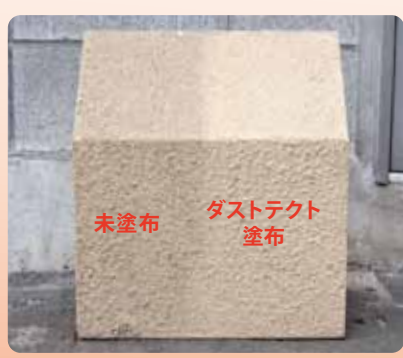
(左)未塗布 (右)ダストテクト塗布

ダストテクトをアクリル樹脂塗料を塗装したコンクリートブロックに塗布。美観維持、防汚効果の高さがわかります。